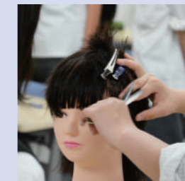
● ビューティー領域