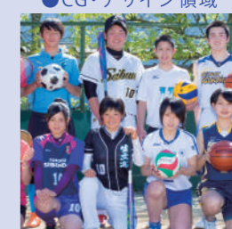
● 健康スポーツ領域