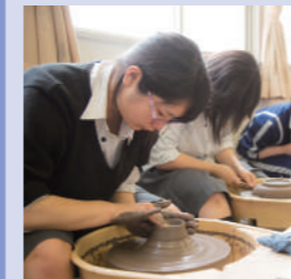
● ものづくり(クラフト)領域