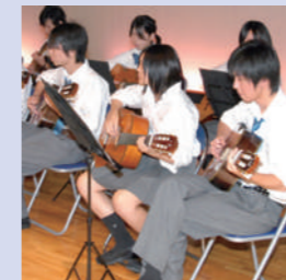
● ミュージック領域