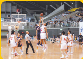
▲バスケットボール部

A もちろん、部活動に打ち込むことができます。特に女子ソフトボール部、女子バレーボール部、男子バスケットボール部、少林寺拳法部、硬式野球部などは盛んで、いずれも県で上位入賞を果たしています。その他の部活動も魅力があり、やりがいもあります。でも、商業科では、多くの資格を取得することを目指しているの、部活動と勉強を両立していくことが必要となります。目指すは『文武両道』です。