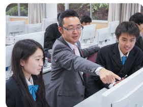
▲個々を大切にされた教員体制