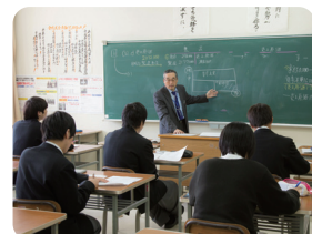
▲放課後や休日にもサポートする課外講習