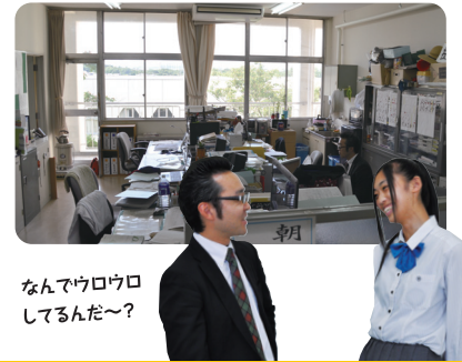
なんでウロウロしてるんだ〜?

簿記の神様と言われていた先生、穏やかな顔をして実はボクサーだった先生、球児として毎日甲子園をめざし練習に明け暮れた先生など…。先生たちはさまざまな分野での経験や知識を通して、一人ひとりの生徒の考え方にしっかり向き合ってアドバイスできる体制を整えたいと思っています。いつのまにか相談してしまうような気軽さは先生たちの努力なんだろうね。これからもご指導お願いいたします!!