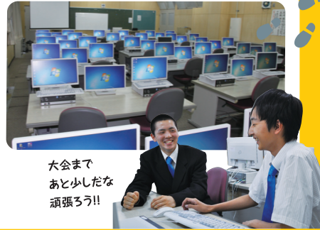
大会まであと少しだな頑張ろう!!

商業科のパソコン室は、放課後自由に使えるのでみんな調べものしたり勉強したりいろんな使い方をしていますね。時々先輩に次に出る大会の話の聞いたり、先生に授業でわからなかったことを質問したりもできて、僕自身この空間は結構重宝しています。趣味の話も盛り上がりやすから、友達との距離もぐっと近づいたりすることも、ここできました。学年関係なくひとつの空間で一緒にになれる機会が多いのは商業科らしさでもあると感じています。