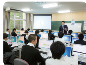
▲商業科の基礎となるパソコン学習

A 生徒のほとんどが廊下等ですれ違うと挨拶をして、特に運動部に所属している生徒については立ち止まってその場で静止して、しっかりと挨拶をすることができ身だしなみもしっかりとしています。とにかくフレンドリーでクラスやコースが違ってても境目がなく、交流することができるのが特徴です。 特に商業科は少人数制により生徒同士の距離はもちろん、先生方との距離が近く親しみやすい環境でのびのびと生活することができます。また先生方の一人ひとりが親身となって生徒の良さを一から無限にまで引き出してくれるのが生文高商業科の雰囲気です。