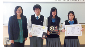
▲大会でのごと入賞!!