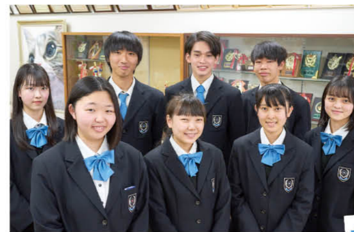
全校生徒を取りまとめる 生徒会総務委員