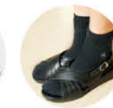
上履きサンダル ※写真は女子用

夏服は、薄めのグレーストライブが入ったボタンダウンシャツに、男子はネクタイ、女子はリボンまたはネクタイを合わせます。涼しげな装いで、動きやすいと好評です。