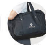
通学バッグ ※希望者のみ購入