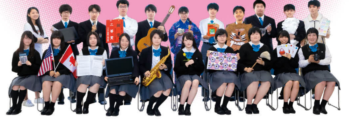
(上段左より)ダンス部・マンガ イラスト部・放送部・JRC・ギター部・茶道部・生文塾・演劇部・科学部・デッサン部・美術部 (下段左より)商業経済研究同好会・語学部・合唱部・パソコン部・吹奏楽部・華道部・家政部・書道部・文学部・写真部