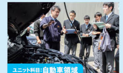
ユニット科目:自動車領域

フード領域に求められる知識と技術を、調理実習をはじめとするたくさんの実習を通して楽しく学びます。協力 仙台YMCA国際ホテル製菓専門学校 / 辻製菓専門学校 他