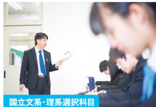
国立文系・理系選択科目

1年次から国・数・英の基礎教科を充実させた週5日7時間授業を実施しています。2年次からは文系・理系に分かれ、受験科目に応じた様々な授業を展開していきます。