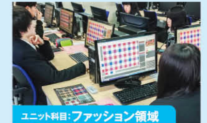
ユニット科目:ファッション領域

理容師・美容師・ビューティー系の仕事について理解しながら、様々な技術を体験し実践的に学んでいきます。協力 仙台ヘアメイク専門学校 / 株式会社紀生 他