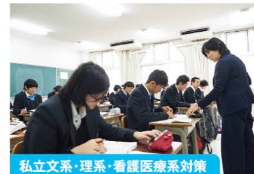
私立文系・理系・看護医療系対策

国・数・英の基礎教科を中心とした学習を実施し、2年次からは文系・理系・看護医療系に分かれ、受験科目に応じた様々な授業を展開していきます。