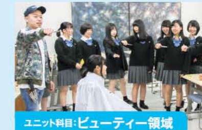
ユニット科目:ビューティー領域

理容師・美容師・ビューティー系の仕事について理解しながら、様々な技術を体験し実践的に学んでいきます。協力 仙台ヘアメイク専門学校 / 株式会社紀生 他