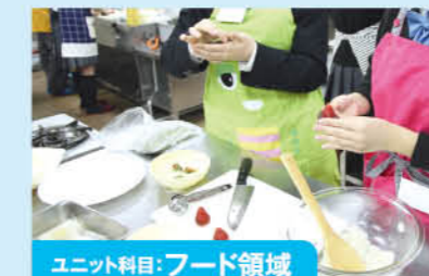
ユニット科目:フード領域

ファッション業界の様々な仕事を理解しながら、様々な実習や理論を通してファッション・アパレル業界について学んでいきます。協力 東北生活文化大学 / 宮城文化服装専門学校 他