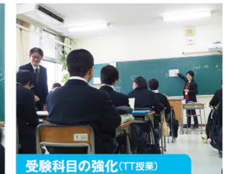
受験科目の強化(TT授業)

受験科目としての英語学習以外にも、生徒の興味関心を高めるための様々な工夫を行っています。