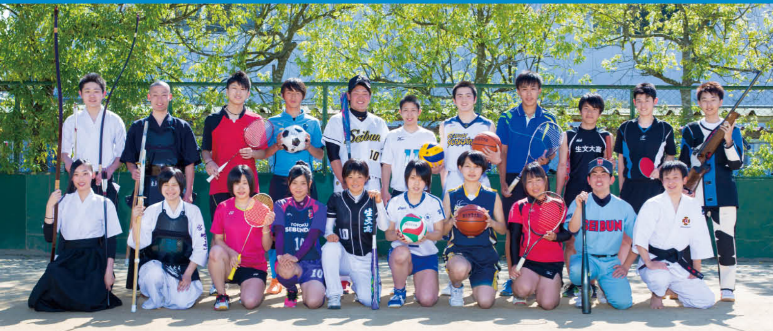
(上段左より)弓道部(男)・剣道部(男)・バドミントン(男)・サッカー部・ソフトボール部(男)・バレーボール部(男)・バスケットボール部(男)・ソフトテニス部(男)・陸上部・卓球部・ライフル射撃同好会 (下段左より)弓道部(女)・剣道部(女)・バドミントン部(女)・サッカー部(女)・ソフトボール部(女)・バレーボール部(女)・バスケットボール部(女)・ソフトテニス部(女)・硬式野球部・少林寺拳法部

女子ソフトボール部……優勝 東北大会・インターハイ出場 男子バスケットボール部……第3位 東北大会出場 少林寺拳法部……東北大会出場 ライフル射撃同好会……全国大会出場