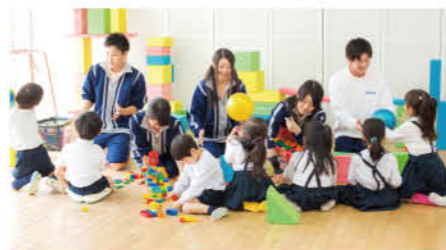
普通科 保育コース