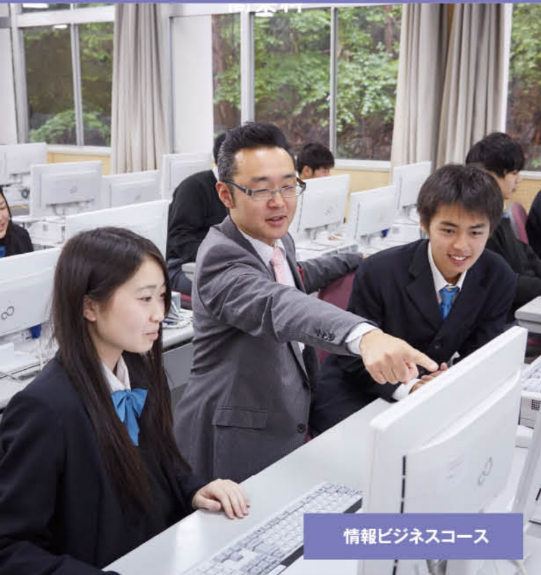
情報ビジネスコース

実学を重視し、就職や進学に有利な資格を積極的に取得することで、未来の可能性がどんどん広がる商業科。一人ひとりがより上級の資格を目指せるように、習熟度に応じたサポートを行っています。