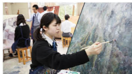
美術・デザイン科