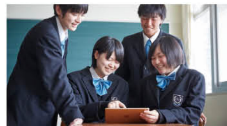
普通科 未来創造コース