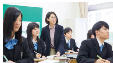
普通科 特別進学コース