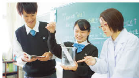
普通科 進学コース