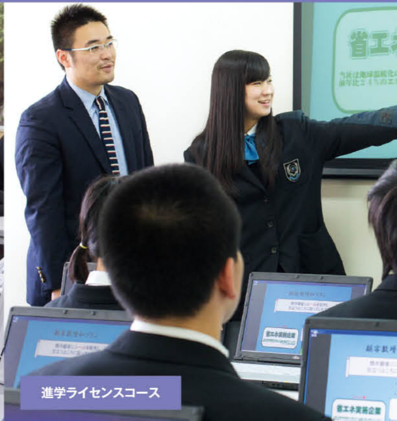
進学ライセンスコース