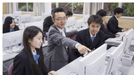
商業科 情報ビジネスコース 進学ライセンスコース