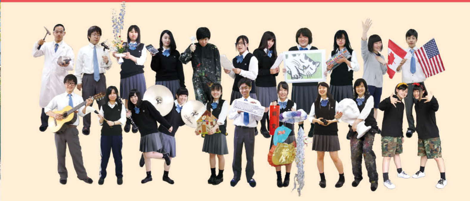
(上段:左より)科学部・放送部・華道部・商業経済研究会・美術部・合唱部・文学部・イラスト・マンガ部・演劇部・語学部 (下段:左より)ギター部・書道部・吹奏楽部・家政部・パソコン部・JRC(課外活動)・写真部・デッサン部・ダンス部

第79回河北美術展16名入選 第31回全国高等学校簿記コンクール出場(個人) 全国商業高等学校情報処理競技大会出場(個人) 第16回全国高等学校ファッションデザイン選手権大会出場(3年連続12回目)