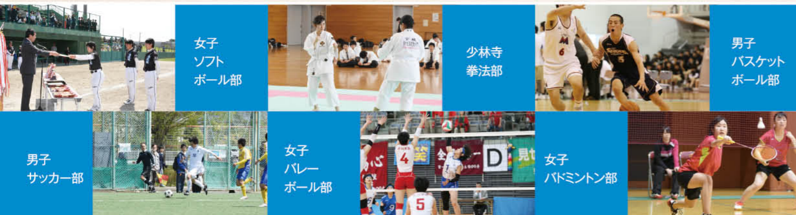
女子ソフトボール部