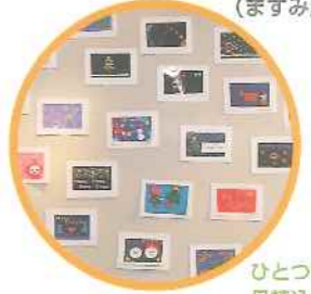
ひとつひとつ丹精込めてつくられた見事な作品。