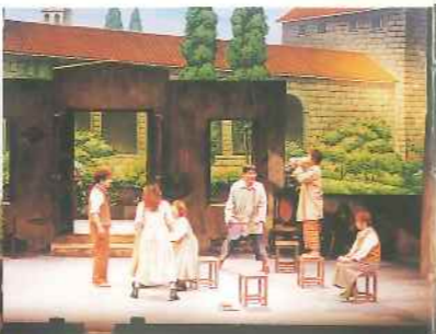
芸術鑑賞会 体の底から溢れ出るパワーに感動！