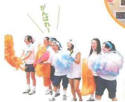
球技大会 応援する方も熱くなる！