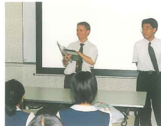
オールラブルコミュニケーション