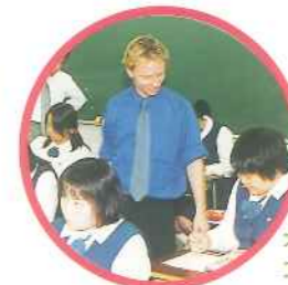
オール コミュニケーション