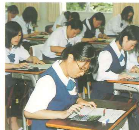
計算事務 かちゃかちゃと電卓の音だけが響きわたる...

商業科の専門教科にはそれぞれ検定があります。はじめての検定ではちょっと緊張するけれど、資格がとれたときの喜びは大きいはず。将来、進学・就職するときにプラスになるのはもちろん、がんばったことが「資格」という自分の財産になるから、みんな「ヤルゾ!」と気合いが入ります。