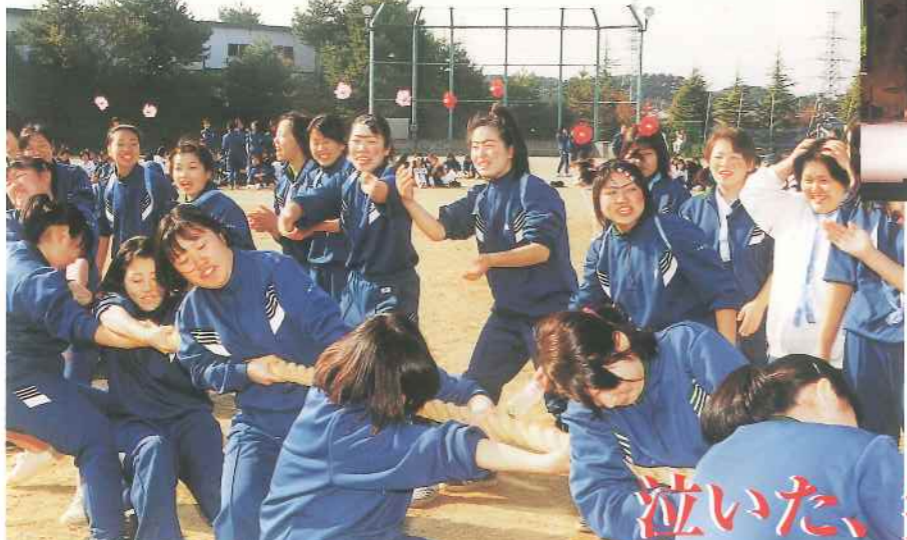
体育祭 クラスがひとつになる団体競技。絶対負けないっ！女のパワーを思い知れ！