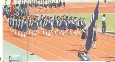
高校総体(入場行進)