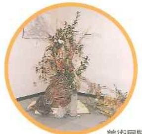
美術展覧会(ますみ展)