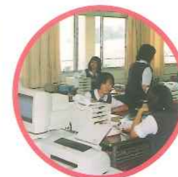
総合実践 よしっ 取引成立!