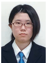
東北生活文化大学 美術学部 美術表現学科