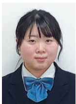
東北生活文化大学 美術学部 美術表現学科