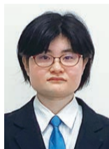
東北生活文化大学 美術学部 美術表現学科