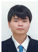
東北生活文化大学 家政学部 家政学科 健康栄養学専攻