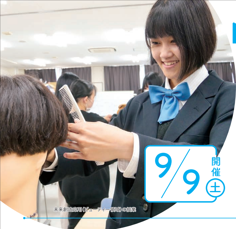
未来創造応用(ビューティー領域)の授業